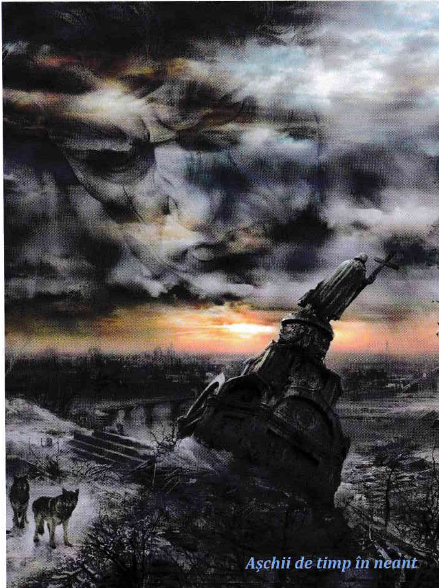
Așchii de timp în neant